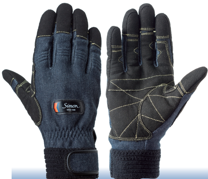
IB(インディゴブルー)